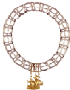
Łańcuch dziekana Kolegium Analiz Ekonomicznych