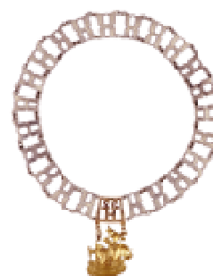
Łańcuch dziekana Studium Magisterskiego