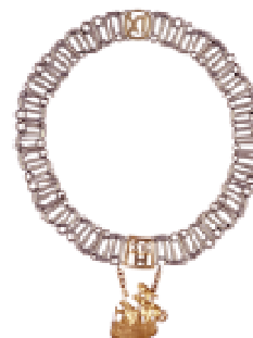
Łańcuch dziekana Kolegium Zarządzania i Finansów