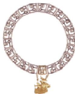
Łańcuch dziekana Kolegium Nauk o Przedsiębiorstwie