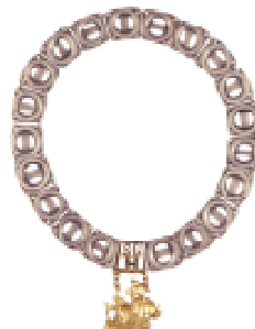
Łańcuch dziekana Kolegium Ekonomiczno-Społecznego