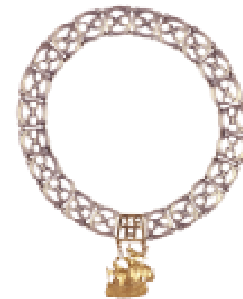
Łańcuch dziekana Kolegium Gospodarki Światowej