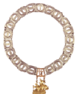
Łańcuch dziekana Studium Licencjackiego